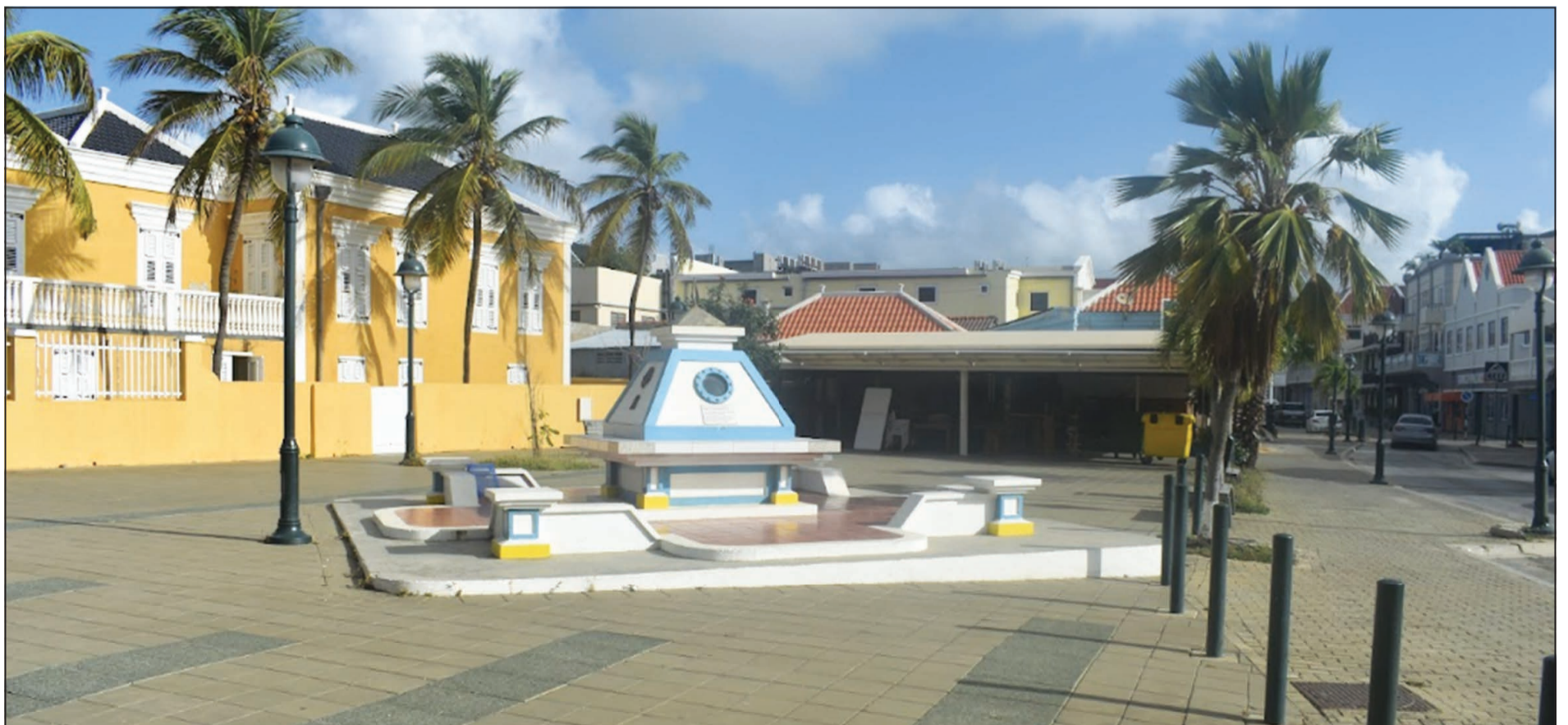
Kápsula di Tempu, proyekto di Bonaire Lions Club, ta unda e kiosko i ofisina di turismo tabata.